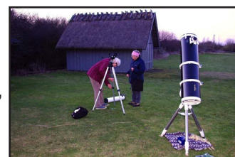
Förberedelser inför Earth Hour på Getterön i år.

Vi har inte kunnat vara så mycket på Naturum Getterön som bl.a. gjort en omfattande ombyggnad men det blir mer framöver, likaså på Världsarvet Grimeton som också ligger bra till. Ju fler intresserade vi kan få med i Varbergs kommun, ju mer kan vi göra och detsamma gäller Hylte.