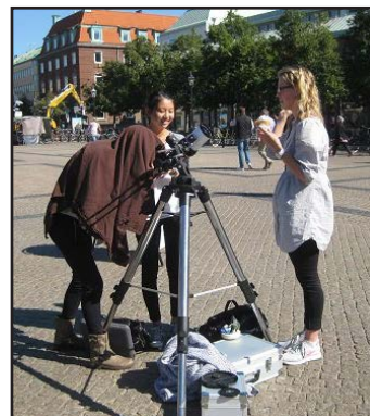
Invigning av solteleskopet.

Titta i programmet, välj datum och maila info@hastro.se !